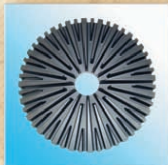
Piatto per alta fusione Heated plate for high melting