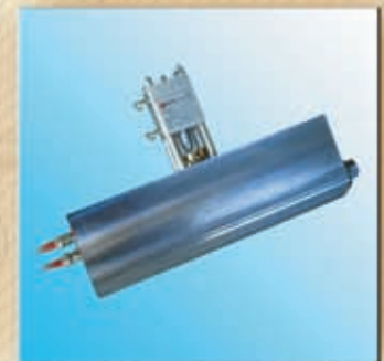
Testa RTS Slot head RTS