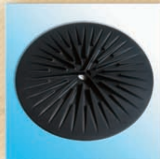
Piatto ad aletta media Heated plate with medium blade